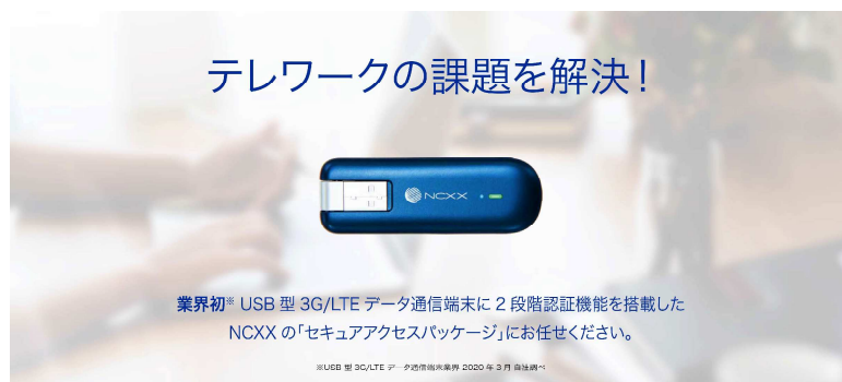
セキュアアクセスパッケージ

また、法的規制強化と車両管理業務の効率化、ドライバーの減少・高齢化など市場を取り巻く社会環境の影響で、需要が増加傾向にあるクラウド型車両管理・動態管理システムにおいて、一定の市場を確保している「OBD IIデータ通信端末」は、新たな製品としてNTT docomo/KDDI/SoftBankや、みちびき（準天頂衛星システム）など、国内の主なLTE周波数である5方式のGNSS*1に対応し、より多くの衛星測位システムを使うことで、ビルや樹木などで視界が狭くなる都市部や山間部でも測位の安定性が向上した「GX700NC」をリリースしております。