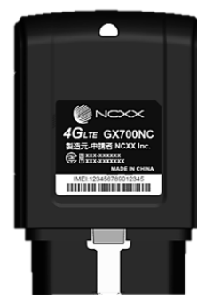
OBD II データ通信端末「GX700NC」

*1 「GNSS」とは「Global Navigation Satellite System（全球測位衛星システム）」の略で、GPS、GLONASS、Galileo、準天頂衛星（QZSS）等の衛星測位システムの総称です。