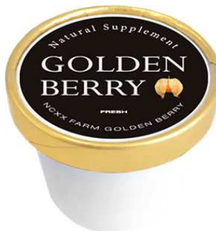
GOLDEN BERRY アイス