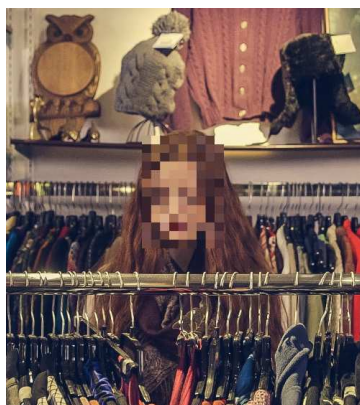
プライバシーに配慮した行動解析

*2 「LPWA」とは、「Low Power Wide Area」の略で、「低消費電力で長距離の通信」ができる無線通信技術の総称。